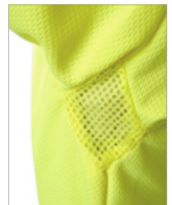
Detalle de las axilas

OEKO-TEX® CONFIDENCE IN TEXTILES STANDARD 100