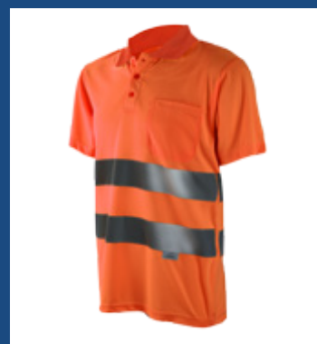
002 Naranja AV