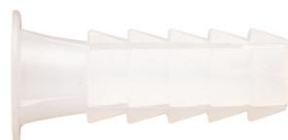
Datos de Instalación