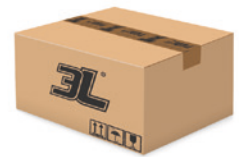
144 pares caja 144 pairs box