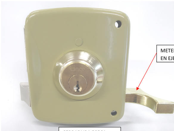
METER EL TIRADOR Y ATAR EL TORNILLO EN EJE DEL PICAPORTE (RESBALON).