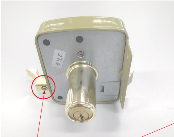
SOLTAR TORNILLO Y SACAR TIRADOR DEL EJE DEL PICAPORTE