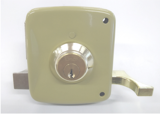
CERRADURA 5056A APERTURA INTERIOR