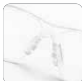
Puente nasal antideslizamiento ajustable