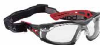
RUSHPFPSI (Rush+ incolora con espuma + cinta elástica)