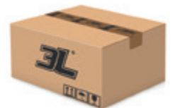
120 pares caja 120 pairs box