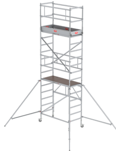
Módulo 1 + 2 + 3