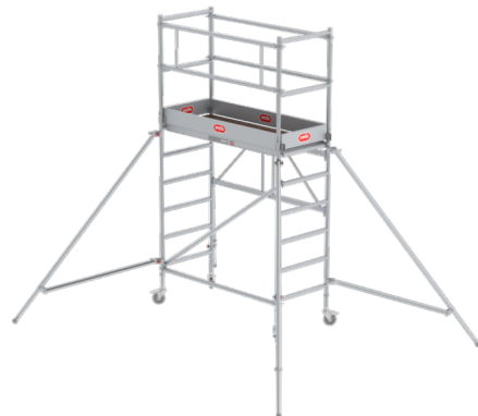
Módulo 1 + 2