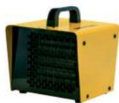
B 2PTC B 3PTC