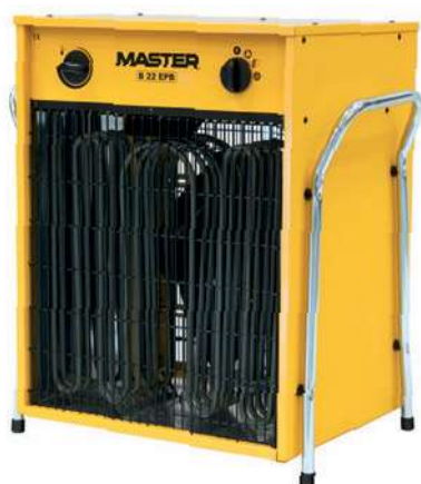
B 5 B 9 B 15 B 22