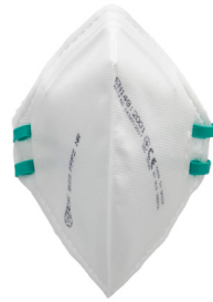
Sin válvula Elásticos soldados BLS 522