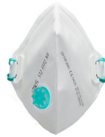
Con válvula Elásticos deslizantes BLS 512V BLS 513V