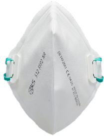
Sin válvula Elásticos deslizantes BLS 512 BLS 513