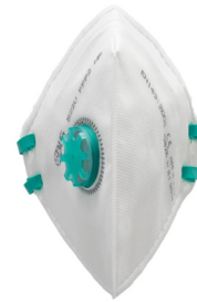
Con válvula Elásticos soldados BLS 522V