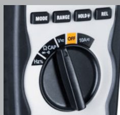
Botón de funciones de fácil manejo