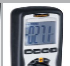
Alarma de vibración