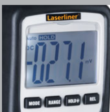
Pantalla de gran tamaño, con iluminación