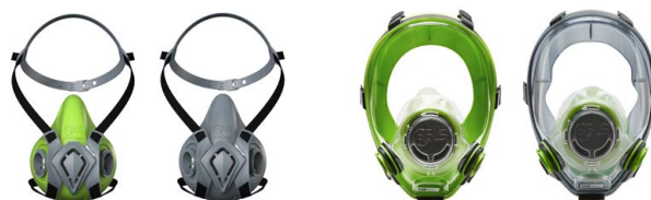
Medias máscaras BLS 4000 ne>xt S - BLS 4000 ne>xt R