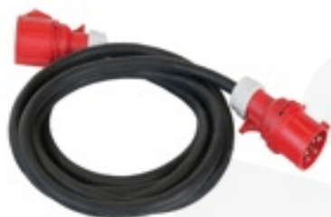
Prolongador H/M 5P 16A (opcional)